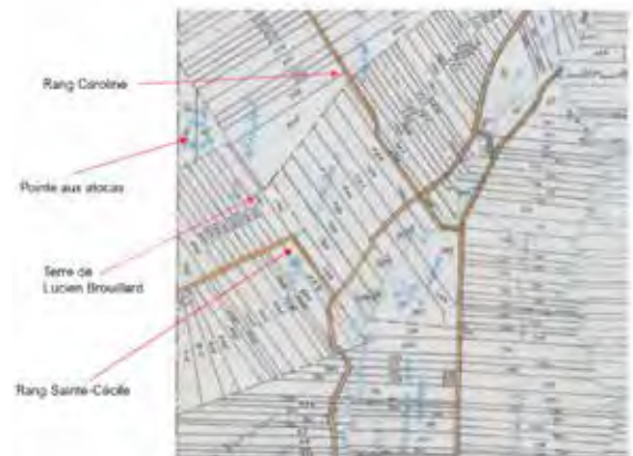
Extrait d'un plan de la paroisse Saint-David Fonds Ministère des Terres et Forêts. 1921

Société d'histoire de Saint-David d'Yamaska