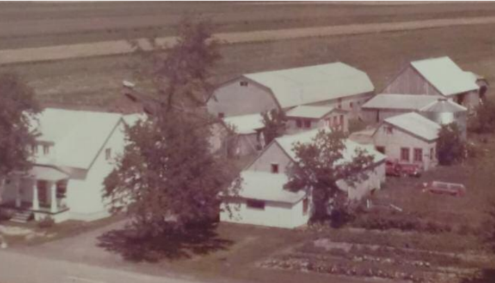
La ferme laitière avant la transformation vers le porc